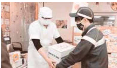
パン屋さんから、ヤマト運輸さんへ

当商工会議所では、「お客様に総社へ足を運んで購入していただきたいが、コロナ禍で難しいこともあり、アンテナショップ的に駅利用客や岡山地域の方に、身近でおいしいパンを食べてほしい」と考えています。