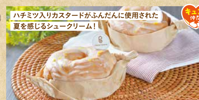
ハチミツ入りカスタードがふんだんに使用された 夏を感じるシュークリーム!