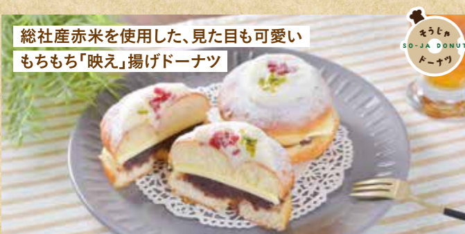
総社産赤米を使用した、見た目も可愛い もちもち「映え」揚げドーナツ

〒 総社市三須825-1 国民宿舎サンロード吉備路内 ☎ 0866-90-0550 🕒 8:00~17:00 📅 無休 👤 17席 🅇 P280台 SHOP DATA