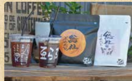
総社ふれんど(ドリップバッグ5個入)みのり/れんげ 各¥650(税込)

大きなオランダ製の焙煎機で気温や湿度によって温度設定や時間を換え、抽出の際にも豆に合わせて淹れ方を変えています。おすすめは総社市長の好みの味を再現した「総社ふれんど」。総社のパン巡りの合間にぜひ立ち寄りください。