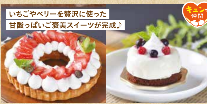
いちごやベリーを贅沢に使った 甘酸っぱいご褒美スイーツが完成!

〒 総社市窪木911-1 ☎ 0866-92-9676 🕒 10:00~18:00 📅 水曜日・不定休 👤 なし 🅇 P5台 SHOP DATA