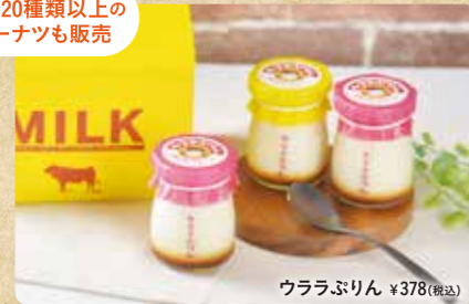
ウララぷりん ¥378(税込)

有機バナラビーンズや県内産の濃厚な生乳などを使用したプレーンなプリンは、なめらかな口溶けと昔懐かしい味でレトロな牛乳瓶の容器が大人気。5~6個購入の方にはオリジナルの牛乳配達BOXに入れてプレゼント。お土産にもおすすめです。