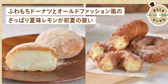
ふわもちドーナツとオールドファッション風の さっぱり夏味レモンが初夏の装い

〒 総社市井手907-1 ☎ 0866-94-1365 🕒 10:00~20:00 (カフェスペースは19:00まで) 📅 火曜日(祝日の場合は営業) 👤 12席 🅇 P11台 SHOP DATA