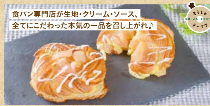
食パン専門店が生地・クリーム・ソース、 全てにこだわった本気の一品を召し上がれ!

〒 総社市駅前1丁目2-3 ☎ 0866-92-0236 🕒 8:00~18:00(閉店後、パンの自動販売機を稼働) 📅 日曜日 👤 なし 🅇 P10台 SHOP DATA