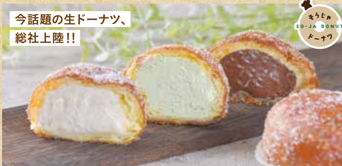
今話題の生ドーナツ、 総社上陸!!