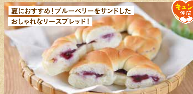
夏におすすめ!ブルーベリーをサンドした おしゃれなリースブレッド!