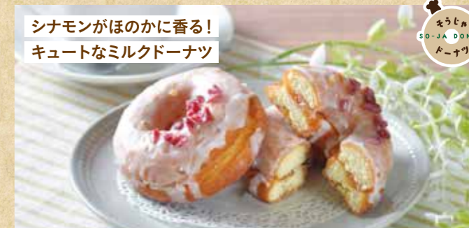
シナモンがほのかに香る! キュートなミルクドーナツ