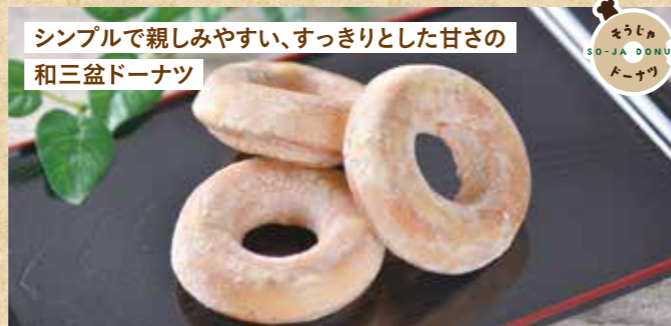
シンプルで親しみやすい、すっきりとした甘さの 和三盆ドーナツ