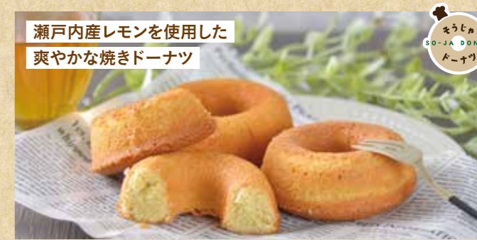
瀬戸内産レモンを使用した 爽やかな焼きドーナツ

〒 総社市中央2丁目7-20 ☎ 0866-37-6248 🕒 9:00~18:00 第1日曜日・祝日 9:00~17:00 📅 第2~5日曜日 👤 なし 🅇 P5台 SHOP DATA