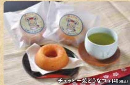
チュッピー焼どうなつ ¥140(税込)

食感はおソドックスな焼ドーナツで、程よくふんわりしています。味はプレーンで甘さ控えめのため、普段甘いものが苦手な男性の方にも人気が高い商品です。見た目にはシンプルですが、その優しい焼き色とほのかな甘い香りがたまりません!