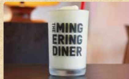
マンゴーヨーグルトスムージー ¥580(税込)

セブ島のドライマンゴーをヨーグルトに漬け込み、甘すぎず、さわやかな味わいとなっています。ロコモコ、ハワイアンフードにぴったりの一品です。