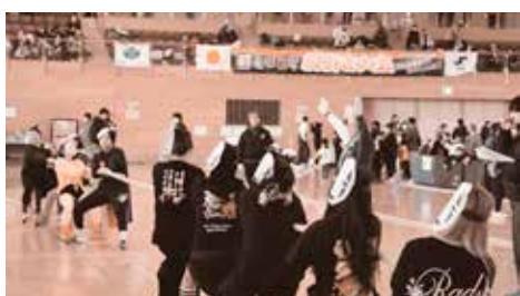
綱引き大会の様子

また、会場の外では市内を中心に営業するキッチンカーが10店舗出店し、おでんやラーメンなど季節に合