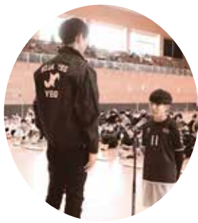
選手宣誓をする小学生

当商工会議所青年部は、去る1月13日(土) きびじアリーナを会場に「第7回絆をつなぐ綱引き大会」を開催しました。大会事業は、「総社市を元気に」をスローガンに、市内に在住の方や通勤・通学されている方々を中心に毎年開催しており、今大会には全5部門で参加総数59チーム、約420名の選手が参加され、寒さ吹き飛ばし白熱した戦いが終日繰り広げられました。