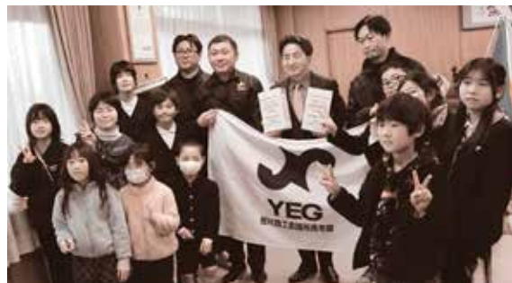
寄付をする子ども達