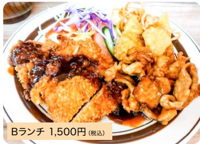
Bランチ 1,500円 (税込)