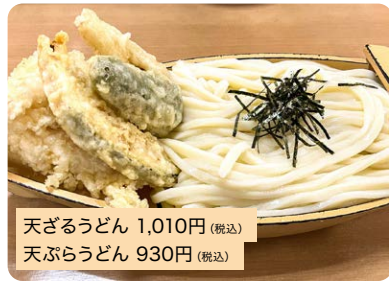
天ざるうどん 1,010円 (税込) 天ぶらうどん 930円 (税込)

衣は卵や混入もの無しで、うどんと同じ小麦粉を使うため、つゆとマッチ。海老天2本が入りボリュームー。*写真は天ざるうどん