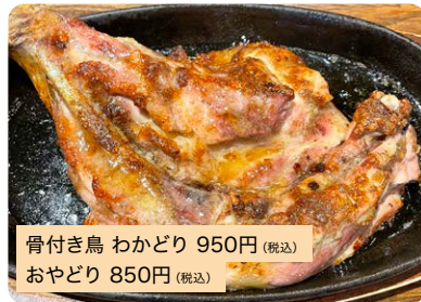
骨付き鳥 わかどり 950円 (税込) おやどり 850円 (税込)

ボリュームあるわかどり、歯ごたえあるおやどり。*テイクアウトできます。*写真はわかどり