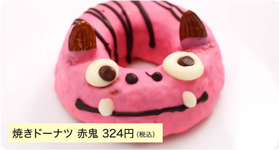
焼きドーナツ 赤鬼 324円(税込)

鬼ノ城に住むやさしい鬼をイメージしたかわい焼きドーナツです。角はアーモンドで表現し、鮮やかなチョココーティングとふわふわな食感がクセになる一品です。赤鬼のほか、青鬼、黄鬼、黒猫もごさいます。