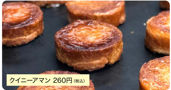
クイニーアマン 260円(税込)

発酵バターをたっぷり折り込んだデニッシュ生地を香ばしくキャラメリゼしたパティスリーならではの品。