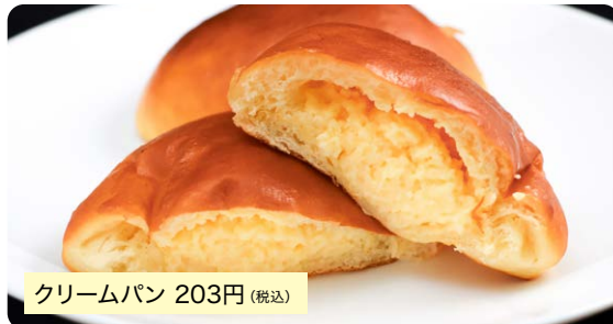
クリームパン 203円(税込)

自家製カスタードに無添加生地、完全無添加クリームパン。甘すぎない口溶けの良いカスタードクリームです。※一日中販売(無くなり次第終了)