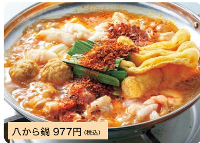
八から鍋 977円 (税込)