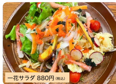
一花サラダ 880円(税込)

大将おすすめのパテトサラダと地元野菜の盛り合わせになります。※14時~20時提供。ランチタイムの注文はご相談ください。