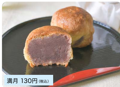
満月 130円 (税込)

看板商品の満月、瓊乃柚(たまのゆ)は総社市民の憩いの味です。満月はこしあんをしっとりとした生地ですつみ、甘すぎず飽きがこない絶妙な職人の技が光る逸品です。※事前予約してからの購入がオススメです。