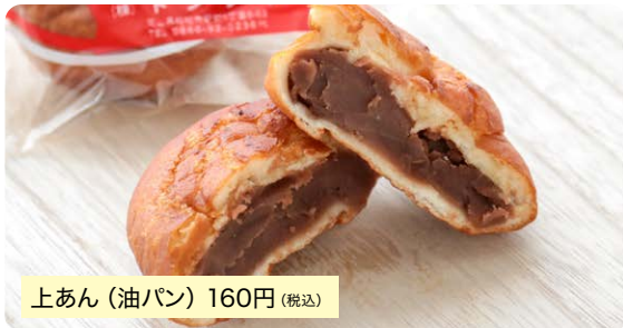
上あん(油パン) 160円(税込)

総社市民4世代に愛されるソウルフードの油パン。袋を開けた瞬間にシナモンが香るモチモチ生地に自家製のこしあんを包んだトングウの看板商品。