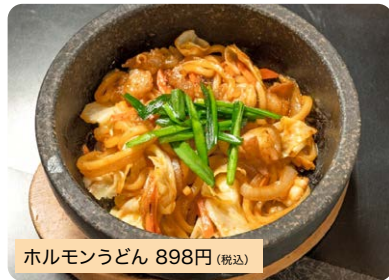
ホルモンうどん 898円 (税込)