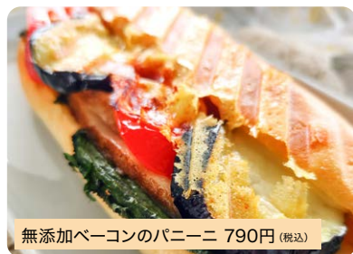
無添加ベーコンのパニーニ 790円(税込)

無添加ベーコンと季節の野菜、たっぷりのチーズをサンドしました。焼立て最高ですよ!