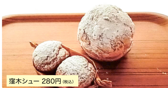
窪木シュー 280円(税込)

当店の一番人気カスタードクリームたっぷりの窪木シュー(280円)、食べやすいサイズの小窪木シュー2個入り(200円)もございます。