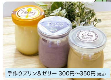
手作りプリン&ゼリー 300円~350円 (税込)

プリンは牛乳、生クリーム、卵、砂糖、バニラビーンズのみを使用し、素材が生きるシンプルな美味しさです。ゼリーも季節のフルーツで美味しく仕上げています。※毎週木曜から限定個数販売。