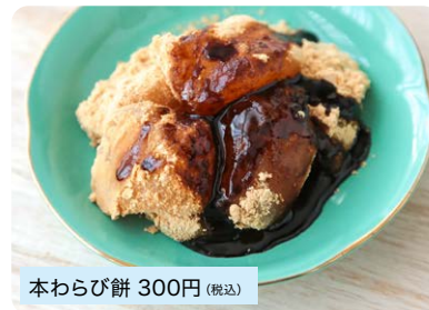
本わらび餅 300円 (税込)

蕨粉、砂糖、水の特別な配合でモチモチ食感に仕上げられています。作り立てを冷凍して販売しています。香ばしくローストした国産きなこを使用しております。※冷凍販売となります。