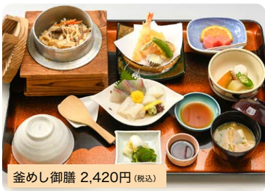
釜めし御膳 2,420円 (税込)