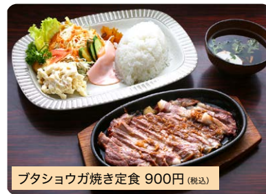
ブタショウガ焼き定食 900円(税込)

人気ランチのブタショウガ焼き、イカショウガ焼き定食などは夕方まで楽しめます。※無くなり次第終了