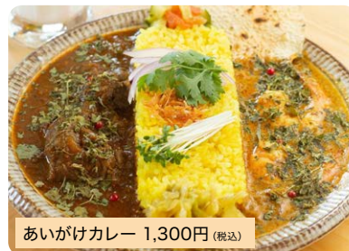
あいがけカレー 1,300円(税込)

15種類以上のスパイスと、こだわりの具材をふんだんに使った自慢のスパイスカレーです。※チキン、牛すじ、エビから2種を選択