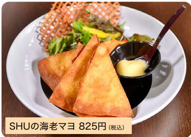
SHUの海老マヨ 825円 (税込)

他店には無い見た目の海老マヨですが、食べればしっかり海老マヨです。*ディナーのみ(クーポンがあればランチ可)