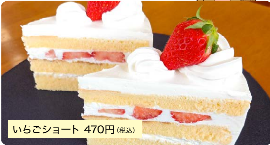
いちごショート 470円(税込)

知る人ぞ知るカルピスの高級生クリームを使用し、甘さ控えめで店主自慢の最高に口どけの良いスポンジで作り上げた一品です。