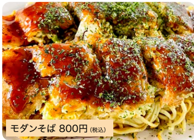
モダンそば 800円 (税込)