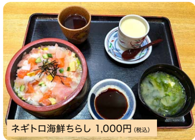
ネギトロ海鮮ちらし 1,000円 (税込)

ネギトロの上にはたくさんの海鮮が載っています!ボリュームもあり、温かい茶碗蒸しと一緒にどうぞ。