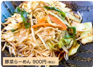
豚菜らーめん 900円 (税込)