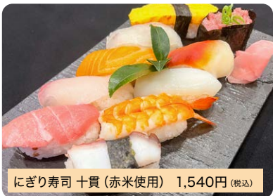
にぎり寿司 十貫 (赤米使用) 1,540円 (税込)

しゃりに地元「赤米」を使用。五貫・七貫・十二貫もごございます。*仕入れ状況により、ネタが変更になる場合がございます。*赤米が完売した場合は白米寿司になります。