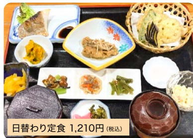
日替わり定食 1,210円 (税込)