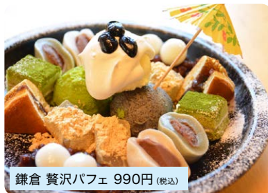
鎌倉 贅沢パフェ 990円 (税込)

鎌倉の和甘味を凝縮したスペシャルパフェです。 ※ドリンクと同時注文で100円引き