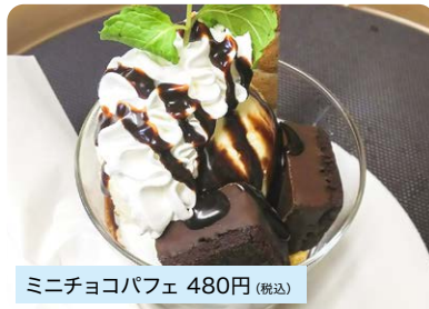
ミニチョコパフェ 480円 (税込)