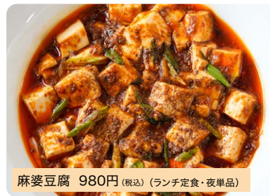
麻婆豆腐 980円(税込)(ランチ定食・夜単品)

ランチでは、土鍋に入れてグツグツと出します。山椒が効いて、あつ、辛い、痺れる五感を感じてもらいたいです。