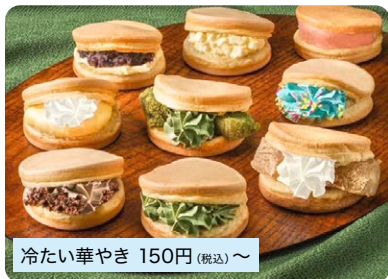
冷たい華やき 150円 (税込) ~

冬に人気の華やき(大判焼)を夏仕様に変じ! 20種類以上あり、選ぶのも楽しいですよ! ※期間限定販売(〜8月末予定)