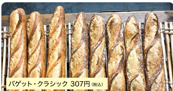
バゲット・クラシック 307円(税込)

バゲット(フランスパン)はヨーロッパでは日本のご飯と同じく食卓に欠かせないものです。当店のバゲットは粉の旨味や甘味を最大限味わってもらえるようシンプルなお配合で仕上げています。※平日2回焼成(朝・昼)、土・日・祝3回焼成(朝・昼・夕方)