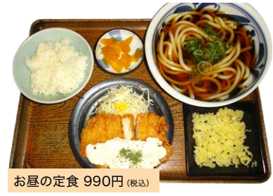
お昼の定食 990円 (税込)

お昼の定食は王道の唐揚げに始まり、タルタルチキンや肉厚コースかつ、白身魚やジャンボアジフライなど全12種類の厳選されたおかずの中からその日の気分によって選べます。*お一人で来店されると200円引き!売り切れ次第終了。