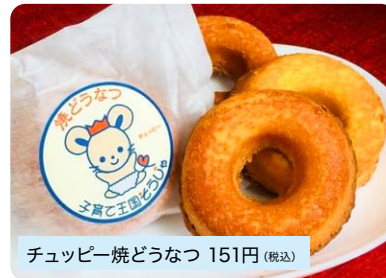
チュッピー焼どうなつ 151円 (税込)