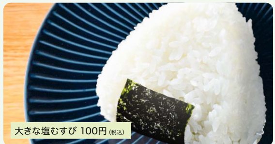
大きな塩むすび 100円(税込)