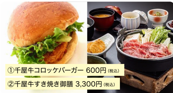
①千屋牛コロッケバーガー 600円(税込)