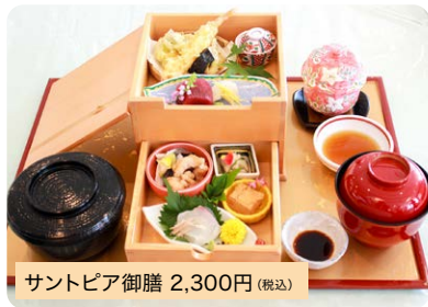
サントピア御膳 2,300円 (税込)

引き出し型2段BOXには、小鉢、天ぷら、お刺身など。少しずついろいろ楽しめます。*ランチにはサラダバーが付きます。