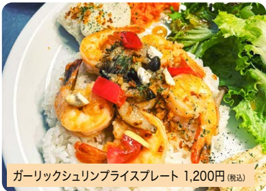
ガーリックシュリンプライスプレート 1,200円 (税込)

ハワイの定番グルメのガーリックシュリンプはハワイ・カリフォルニアスタイルの当店でも大人気です。