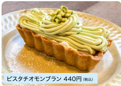
ピスタチオモンブラン 440円 (税込)

ピスタチオを練り込んだ見た目も可愛いタルトケーキ。ランチ後のケーキセットにも! ※ティークラウトもOKです!