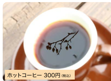
ホットコーヒー 300円(税込)

どの珈琲でも1杯300円でお楽しみいただけます。また、アイスコーヒー、カフェオレは1杯400円です。もちろん、焙煎珈琲豆も各種販売しています。