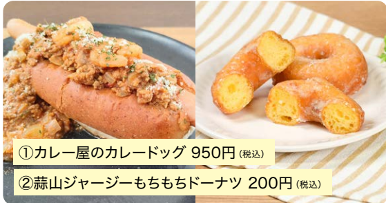
①カレー屋のカレードッグ 950円(税込)