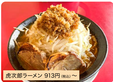
虎次郎ラーメン 913円(税込)〜

総社初二郎系ラーメン。麺、トッピングはお好みの量で注文できます。今一番美味しいラーメンを作るをモットーに常に改良を重ね続けた一杯。