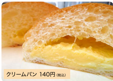
クリームパン 140円 (税込)

ふわっふわっのパン生地と甘さ控えめのなめらかな自家製カスタードクリームの相性抜群の看板商品です。