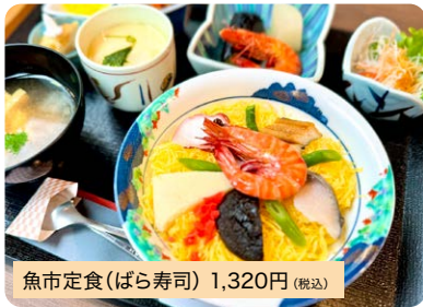
魚市定食(ばら寿司) 1,320円 (税込)