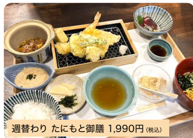
週替わり たにもと御膳 1,990円(税込)

こだわりの天ぷらを揚げたてでご提供。地産地消のお野菜、旬の食材を取り入れています。※夜は御膳の提供はございません