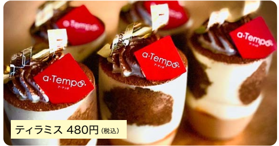
ティラミス 480円(税込)

想像できる味を裏切らないようスタンダードに作っていますが、底にカフェムースと塩キャラメルを入れ、少しパンチの効いた味変が楽しめます。見た目もユニークなのでティラミス好きの方はぜひお召し上がりください。