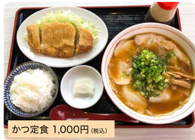
かつ定食 1,000円 (税込)