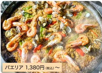
パエリア 1,380円 (税込)~

本場スペインで修業したシェフが作るこだわりのパエリアです。寄島産の魚と海老などで丁寧に汁を取っています。*ランチタイムは数量限定