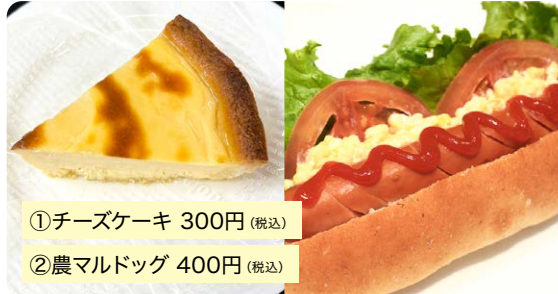
①チーズケーキ 300円(税込)