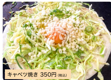
キャベツ焼き 350円(税込)

昔ながらの洋食焼きです。朝・昼・夜のおかずの一品としてもおやつやビールのあてとしてもオススメです。具材はキャベツ・玉子・青ネギ・天かすとシンプルかつ低カロリーでヘルシーです。