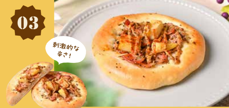
03 ピリ辛ジャーマンポテト 340円(税込)

国民宿舎サンロード吉備路 ベーカリーカフェ クルール 〒 総社市三須825-1 国民宿舎サンロード吉備路内 ☎ 0866-90-0550 🕒 8:00~17:00 📅 不定休