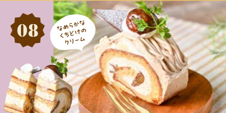
08 マロン 1本1,800円、カット500円(税込)

小さな洋菓子店 Petite Graine プティ・グレイン 〒 総社市窪木911-1 ☎ 0866-92-9676 🕒 10:00~18:00 📅 水曜(祝日の場合は翌日)・不定休