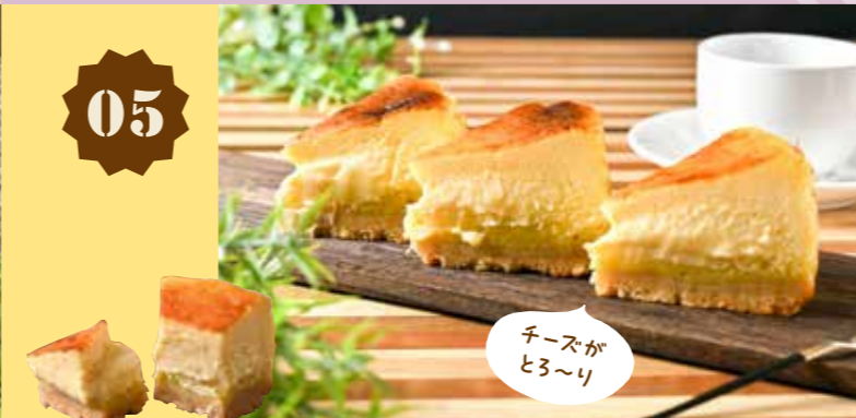
05 紅はるかのかのバスクチーズケーキ by いとお菓子なえん 480円(税込)

AMBROSIA アンブロシア 〒 総社市駅南1丁目35-18 ☎ 0866-92-7377 🕒 7:30~18:00 📅 月・火曜