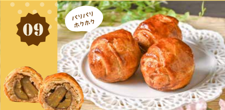
09 マロンパン 430円(税込)

ブランノエル Blanc noel 〒 総社市井手907-1 ☎ 0866-94-1365 🕒 10:00~20:00 ※カフェスペースは19:00まで 📅 火曜(祝日の場合は営業)