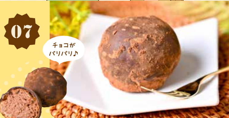
07 チョコまる 210円(税込)

農マル園芸吉備路農園 ケーキ工房 〒 総社市西郡411-1 ☎ 0866-31-5235 🕒 10:00~17:00 📅 年末年始のみ