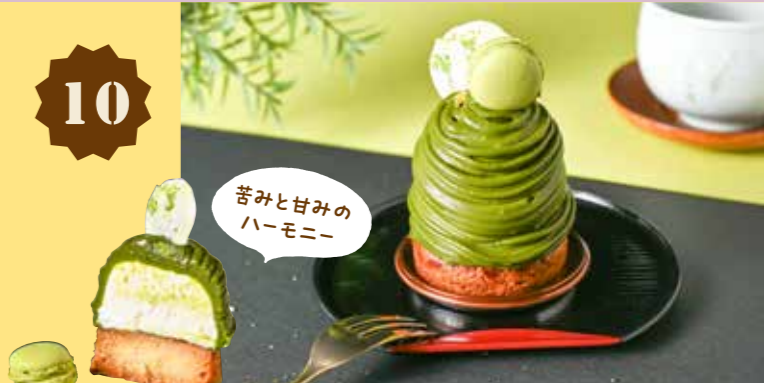
10 恋茶 koitya 540円(税込)

Pâtisserie Coa パティスリー・コア 〒 総社市中央1丁目23-107 フィネスK1 102 ☎ 0866-33-9114 🕒 11:00~18:00 📅 月・火・水曜