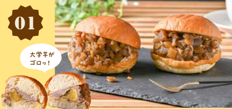
01 びっ栗モンブラン 230円(税込)

たっぷりのマロンペーストをパンで挟み、甘く煮た栗をまぶした、ビックリするようなボリュームのマリトツォ風モンブラン。中には大学芋が忍ばせてあり、一口ごとに秋の味覚を存分に楽しめる一品です。※数量限定