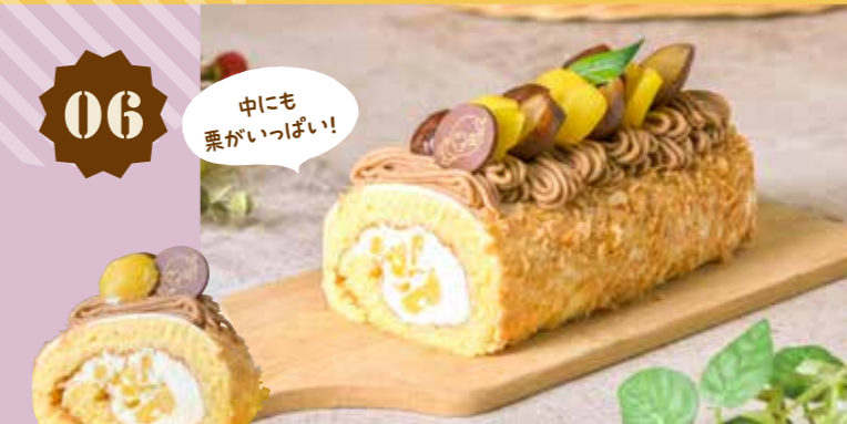
06 栗ロール 2,100円(税込)

キッチンテラスSOJA そらcafé いとお菓子なえん 〒 総社市総社1012-1 ☎ 090-1331-6567 🕒 11:00~17:00 📅 水曜