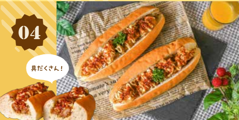
04 ビックリするほど辛そうなのに 辛くない唐揚げサンド 429円(税込)

ナンバベーカリー 〒 総社市駅南2丁目34-1 ☎ 0866-95-2866 🕒 7:30~18:30 (土日祝 7:30~18:00) 📅 火曜・不定休