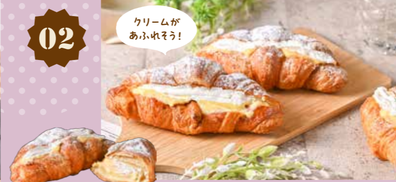
02 カスタードモリモリクロワッサン 280円(税込)

ベーカリー トングウ 〒 総社駅前1-2-3 ☎ 0866-92-0236 🕒 8:00~18:00 📅 日・月曜(正月、GW、夏季など長期休業あり)