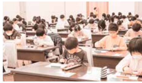
日頃の成果を発揮する生徒