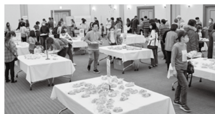
パンフェス当日の様子

昨年11月3日(日)にはパンわーど総社8周年感謝祭「人気のご当地パン大集合 地域まるごとパンフェス2024」を国民宿舎サンロード吉備路にて開催しました。全国からご当地パンを集めての開催は今回で3回目となり、パンわーど総社参加7店舗のパンや焼き菓子と10種類のご当地パンが集まりました。昨年も人気のあった「三角チーズパン(大分県)」「みかんメロンパン(愛媛県)」に加え、新たに大阪府の「東大阪ラグカレー」や群馬県の「みそぼん」などテレビでも取り上げられているご当地パンが集結。360名限定の事前抽選に対し、2,000通を超える応募があり、当日購入した方からは「パンわーど総社が好きで参加しました」「毎年開催してほしい」との声があがりました。