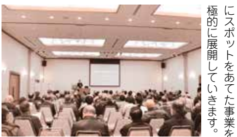
熱心に講演を聴講する参加者

今年(2025年)は、多くの文化財と歴史的背景を有する吉備路の魅力をもっと多くの方に知っていただくことを目的に、平成10年より継続し開催しています。