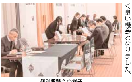
個別懇談会の様子

近年就職した方々の4割が3年以内に離職しているとのデータがあることから、就職前後で認識の齟齬をできるだけなくし、また総社市内の企業をより知っていただくことを目的に昨年に続き2回目の開催となりました。