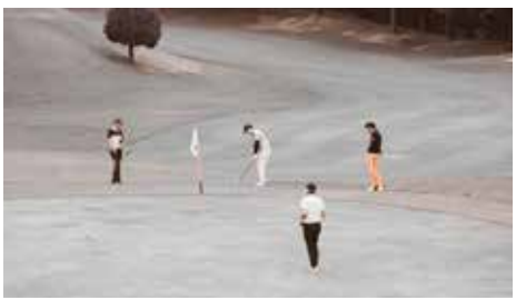
ゴルフを楽しみ親睦を深める参加者

当日は54名に参加いただき、今年は第1組が朝8時からアウト・インコースに分かれてスタート、絶好のゴルフ日和に恵まれ一打一打に気持ちを込めて、楽しい一日を過ごされたようでした。