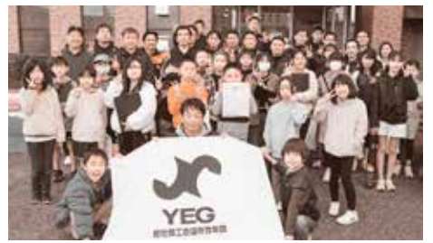
参加した子どもたちと青年部メンバー