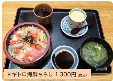
ネギトロ海鮮ちらし 1,300円 (税込)

ネギトロの上にはたくさんの海鮮が載っています!ボリュームもあり、温かい茶碗蒸しと一緒にどうぞ。