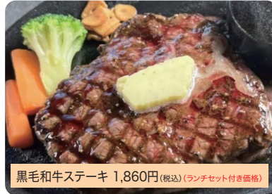
黒毛和牛ステーキ 1,860円(税込)(ランチセット付き価格)

ランチタイム1番人気の黒毛和牛ステーキ。国産黒毛和牛をリーズナブルにお楽しみください。