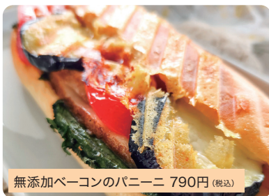
無添加ベーコンのパニーニ 790円(税込)

無添加ベーコンと季節の野菜、たっぷりのチーズをサンドしました。焼立て最高ですよ!