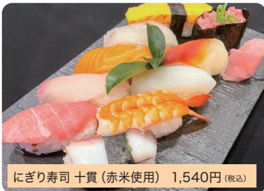
にぎり寿司 十貫(赤米使用) 1,540円(税込)

しゃりに地元「赤米」を使用。五貫・七貫・十二貫もございます。*仕入れ状況により、ネタが変更になる場合がございます。*赤米が完売した場合は白米寿司になります。