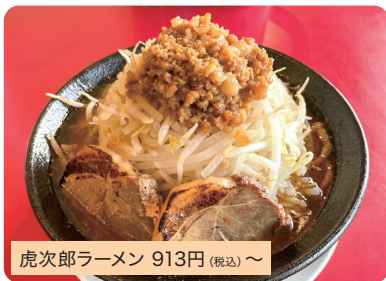
虎次郎ラーメン 913円(税込)〜

総社初二郎系ラーメン。麵、トッピングはお好みの量で注文できます。今一番美味しいラーメンを作るをモットーに常に改良を重ね続けた一杯。