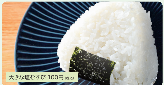
大きな塩むすび 100円(税込)