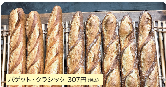
バゲット・クラシック 307円 (税込)

バゲット (フランスパン) はヨーロッパでは日本のご飯と同じく食卓に欠かせないものです。当店のバゲットは粉の旨味や甘味を最大限味わってもらえるようシンプルなお配合で仕上げています。※平日2回焼成(朝・昼)、土・日・祝3回焼成(朝・昼・夕方)