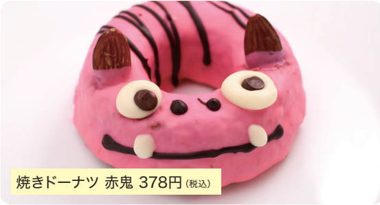
焼きドーナツ 赤鬼 378円(税込)

鬼ノ城に住むやさしい鬼をイメージしたかわいい焼きドーナツです。角はアーモンドで表現し、鮮やかなチョココーティングとふわふわな食感がクセになる一品です。赤鬼のほか、青鬼、黄鬼、黒猫もごさいます。