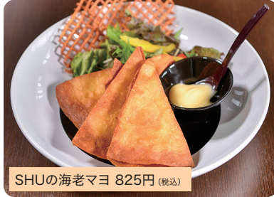
SHUの海老マヨ 825円(税込)

他店には無い見た目の海老マヨですが、食べればしっかり海老マヨです。*ディナーのみ(クーポンがあればランチも可)