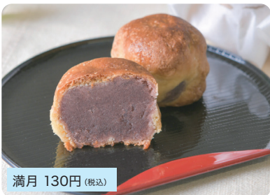
満月 130円 (税込)

看板商品の満月、瓊乃柚(たまのゆ)は総社市民の憩いの味です。満月はこしあんをしっとりとした生地であつみ、甘すぎず飽きがこない絶妙な職人の技が光る逸品です。※事前予約しからの購入がオススメです。