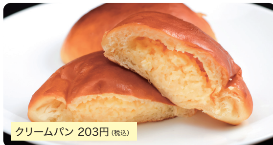
クリームパン 203円 (税込)

自家製カスタードに無添加生地、完全無添加クリームパン。甘すぎない口溶けの良いカスタードクリームです。※一日中販売(無くなり次第終了)