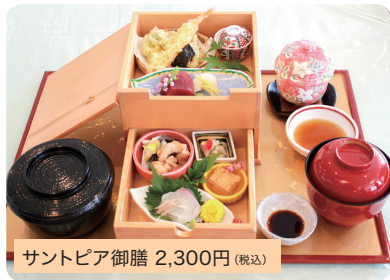
サントピア御膳 2,300円 (税込)

引き出し型2段BOXには、小鉢、天ぷら、お刺身など。少しずついろいろ楽しめます。*ランチにはサラダバーが付きます。