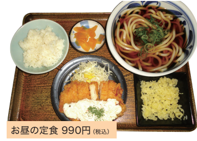
お昼の定食 990円(税込)

お昼の定食は王道の唐揚げに始まり、タルタルチキンや肉厚コースかつ、白身魚やジャンボアジフライなど全12種類の厳選されたおかずの中からその日の気分によって選べます。*お一人で来店されると200円引き!売り切れ次第終了。