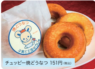
チュッピー焼どうなつ 151円 (税込)