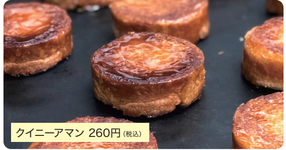
クイニーアマン 260円(税込)

発酵バターをたっぷり折り込んだデニッシュ生地を香ばしくキャラメリゼしたパティスリーならではの品。