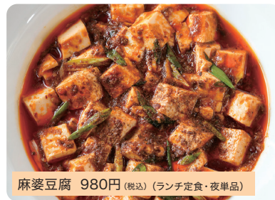
麻婆豆腐 980円(税込)(ランチ定食・夜単品)

ランチでは、土鍋に入れてグツグツと出しています。山椒が効いて、あつっ、辛い、痺れる五感を感じてもらいたいです。