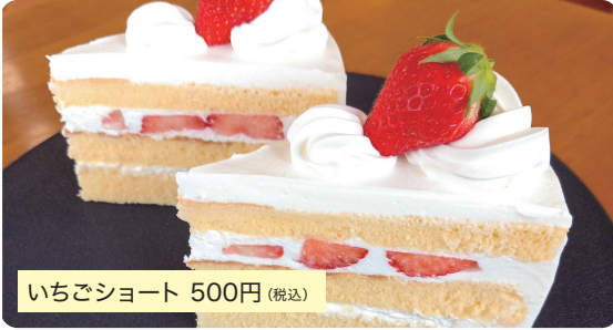
いちごショート 500円(税込)

知る人ぞ知るカルピスの高級生クリームを使用し、甘さ控えめで店主自慢の最高に口どけの良いスポンジで作り上げた一品です。