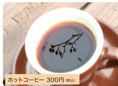
ホットコーヒー 300円(税込)

どの珈琲でも1杯300円でお楽しみいただけます。また、アイスコーヒー、カフェオレは1杯400円です。もちろん、焙煎珈琲豆も各種販売しています。