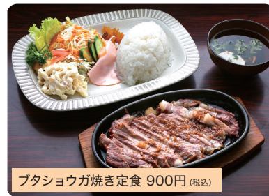
ブタショウガ焼き定食 900円(税込)

人気ランチのブタショウガ焼き、イカショウガ焼き定食などは夕方まで楽しめます。※無くなり次第終了