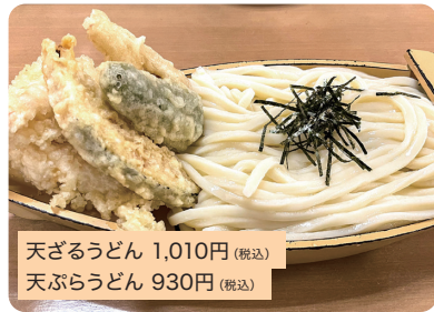
天ざるうどん 1,010円 (税込) 天ぶらうどん 930円 (税込)

衣は卵や混入もの無しで、うどんと同じ小麦粉を使うため、つゆとマッチ。海老天2本が入りボリュームー。*写真は天ざるうどん