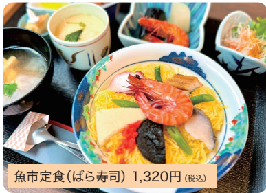
魚市定食(ばら寿司) 1,320円 (税込)