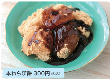
本わらび餅 300円 (税込)

蕨粉、砂糖、水の特別な配合でモチモチ食感に仕上げています。作り立てを冷凍して販売しています。香ばしくローストした国産きなこを使用しております。※冷凍販売となります。