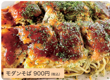
モダンそば 900円 (税込)