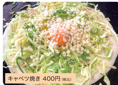
キャベツ焼き 400円(税込)

昔ながらの洋食焼きです。朝・昼・夜のおかずの一品としてもおやつやビールのあてとしてもオススメです。具材はキャベツ・玉子・青ネギ・天かすとシンプルかつ低カロリーでヘルシーです。