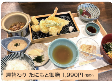
週替わり たにもと御膳 1,990円(税込)

こだわりの天ぷらを揚げたてでご提供。地産地消のお野菜、旬の食材を取り入れています。※夜は御膳の提供はございません