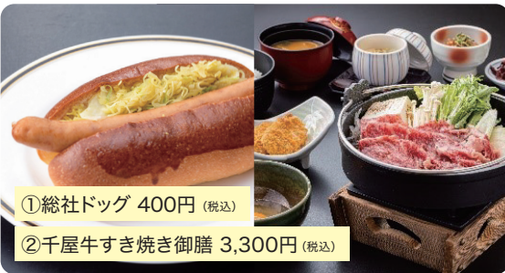
①総社ドッグ 400円(税込)