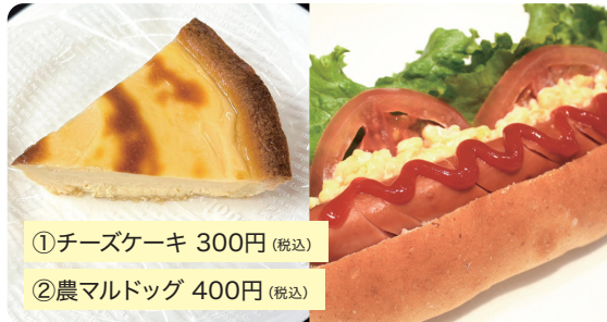
①チーズケーキ 300円 (税込)