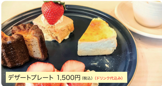
デザートプレート 1,500円 (税込) (ドリンク代込み)

季節のフルーツやアイス、そしてその日の販売ケーキや焼き菓子などが乗ります。なので、内容はその日のお楽しみです!