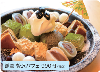
鎌倉 贅沢パフェ 990円 (税込)

鎌倉の和甘味を凝縮したスペシャルパフェです。 ※ドリンクと同時注文で100円引き