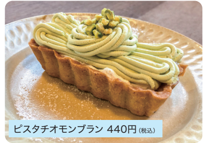
ピスタチオモンブラン 440円 (税込)

ピスタチオを練り込んだ見た目も可愛いタルトケーキ。ランチ後のケーキセットにも! ※テイクアウトもOKです!