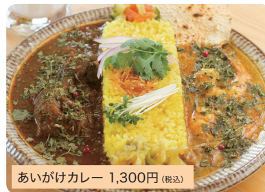
あいがけカレー 1,300円(税込)

15種類以上のスパイスと、こだわりの具材をふんだんに使った自慢のスパイスカレーです。※チキン、牛すじ、エビから2種を選択