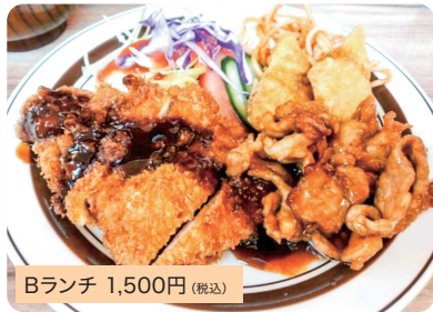
Bランチ 1,500円 (税込)