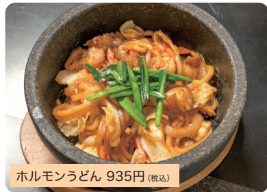
ホルモンうどん 935円 (税込)