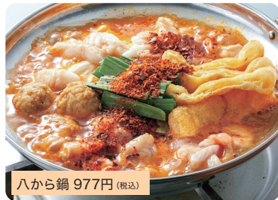
八から鍋 977円 (税込)