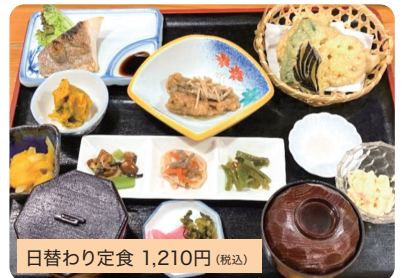
日替わり定食 1,210円(税込)