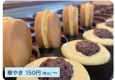
華やき 150円 (税込) ~

わらび餅屋さんの冬季の名物"華やき(大判焼)".以前のお店から愛されてきた華やきを味や生地感をバージョンUPさせて販売しております。是非、一度お試しいただきませ。※お電話にてご予約をオススメします