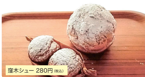
窪木シュー 280円 (税込)

当店の一番人気カスタードクリームたっぷりの窪木シュー (280円)、食べやすいサイズの小窪木シュー2個入り (200円) もございます。