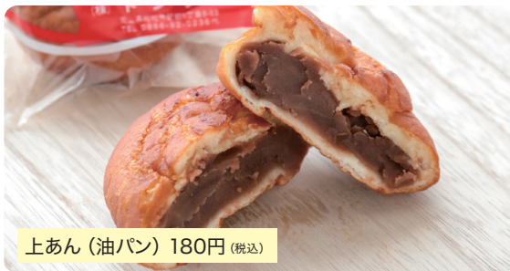
上あん (油パン) 180円 (税込)

総社市民4世代に愛されるソウルフードの油パン。袋を開けた瞬間にシナモンが香るモチモチ生地に自家製のこしあんを包んだトングウの看板商品。