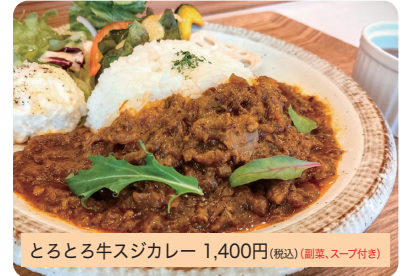
とろとろ牛スジカレー 1,400円(税込)(副菜、スープ付き)

とろとろになるまで煮込んだ牛スジと玉ねぎで、牛肉のうまみと玉ねぎの甘みがギュッと凝縮したコク深い味わいのカレーに仕上がりました。ふりふりエビの濃厚ビスカカレー 1,600円/やわらか鶏肉カレー、エビとニラのキーマカレー 各1,400円(税込)(副菜、スープ付き)もご用意。 ※テイクアウトもできます