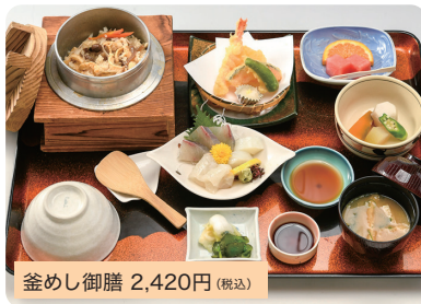
釜めし御膳 2,420円(税込)