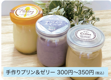
手作りプリン&ゼリー 300円~350円 (税込)

プリンは牛乳、生クリーム、卵、砂糖、バニラビーンズのみを使用し、素材が生きるシンプルな美味しさです。ゼリーも季節のフルーツで美味しく仕上げています。※毎週木曜から限定個数販売。