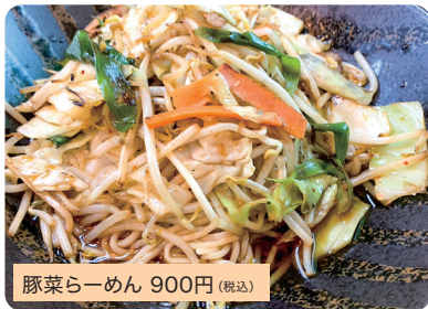
豚菜らーめん 900円 (税込)