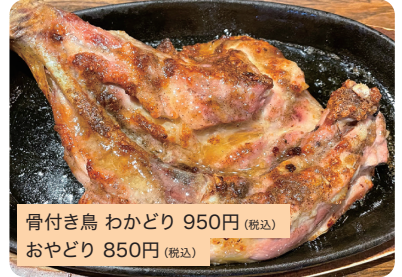
骨付き鳥 わかどり 950円(税込) おやどり 850円(税込)

ボリュームあるわかどり、歯ごたえあるおやどり。*テイクアウトできます。*写真はわかどり