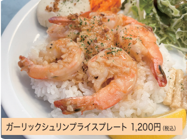
ガーリックシュリンプライスプレート 1,200円(税込)

ハワイの定番グルメのガーリックシュリンプはハワイ・カリフォルニアスタイルの当店でも大人気です。