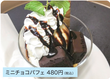
ミニチョコパフェ 480円 (税込)