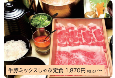
牛豚ミックスしゃぶ定食 1,870円(税込)~

おひとり様毎に特注銅鍋、厳選された食材をご用意。お得に満足できる定食は平日ランチタイム限定(各種肉・野菜盛り・豆腐・日の出製麺所うどん・ライス) ※価格改定可能性アリ