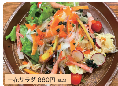
一花サラダ 880円(税込)

大将おすすめポテトサラダと地元野菜の盛り合わせになります。※14時~20時提供。ランチタイムの注文はご相談ください。