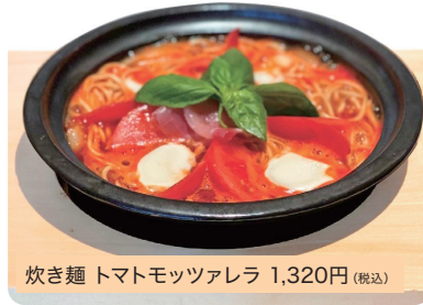
炊き麺 トマトモツアレラ 1,320円(税込)

炊き麺・炊き餃子の他、支那そばや担々麺、丼ものもご用意!美星豚の豚カツも人気です。