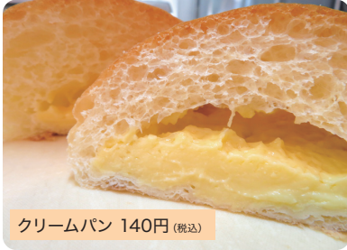
クリームパン 140円(税込)

ふわっふわっのパン生地と甘さ控えめのなめらかな自家製カスタードクリームの相性抜群の看板商品です。